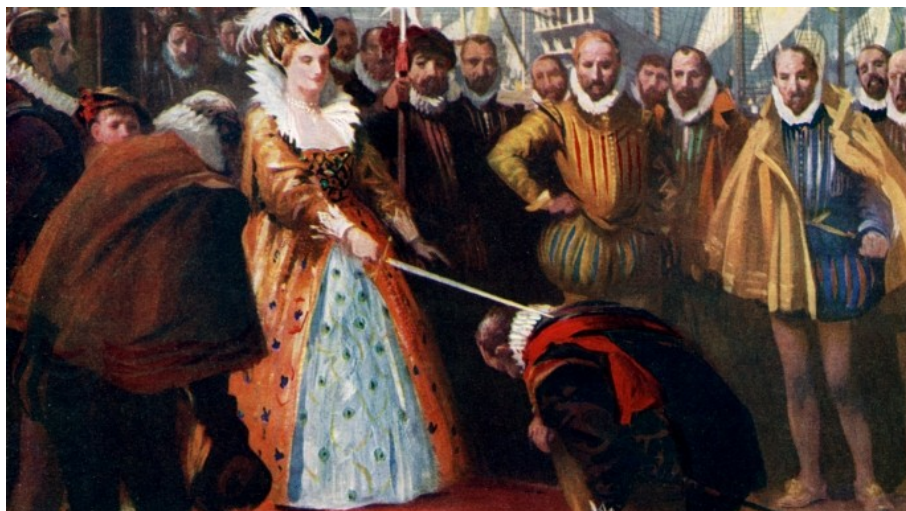
La reine le fait chevalier.