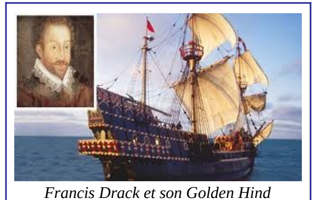
Francis Drake et son Golden Hind

Elle décidera d'élargir ses échanges vers la Méditerranée et la Baltique (avec les villes de la ligue Hanséatique