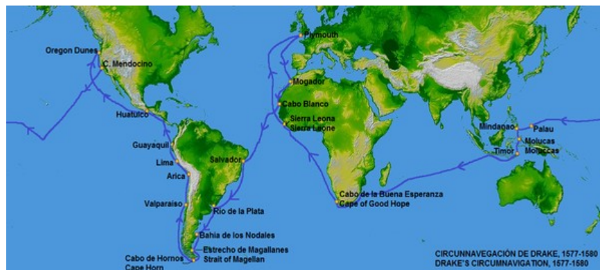
Le tour du monde de Francis Drake

On se laisse porter par les Alizés le long des côtes européennes puis africaines. Près du Cap Vert, on arraisonne des navires espagnols et portugais qui vont compléter les effectifs. On traverse l'Atlantique. On suit la route de Magellan le long des côtes Est et Sud du nouveau