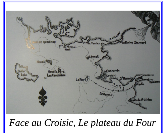
Face au Croisic, Le plateau du Four

{PV-1} p.198 - On lira avec intérêt le récit du commandant de l'Hermione Pierre Martin dans lequel il met violemment en cause le citoyen Guillaume, pilote côtier.