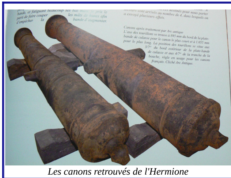
Les canons retrouvés de l'Hermione