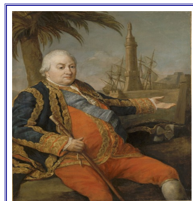
Pierre André Suffren

joindre au convoi de quatre vaisseaux hollandais chargés de porter la légion du Luxembourg pour renforcer la garnison de Trinquemalay - port situé sur la côte est de l'île de Ceylan – actuel Sri Lanka»