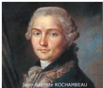
Jean-Baptiste ROCHAMBEAU Comte de Rochambeau