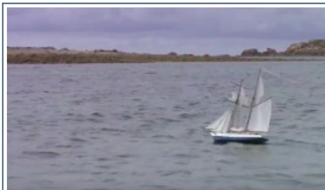
Été 2017, « Persée » sous forte brise

Cette version numérique (.pdf) permet l'accès à des documents internet complémentaires : ( W ) pour des liens vers Wikipédia, ( S ) pour Sites privés, ( Yt..mn ) pour YouTube, ( A ) pour mon site et ses annexes.